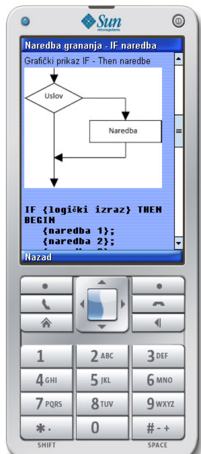
Slika 1: Ekran sa lekcijom

Posle preuzimanja sa veb servera škole ili preko bluetooth-a, aplikaciju je potrebno instalirati. Aplikacija je vrlo jednostavna za korišćenje. Na naslovnoj strani učenici biraju lekciju koju obrađuju. Pored standardnih sadržaja ( sl. 1 ) učenici imaju mogućnos da provere znanje iz lekcije koju su naučili ( sl. 2 ). Na kraju svake provere znanja dobijaju broj osvojenih poena i ocenu za koju su znali. Uz teorijsku proveru znanja učenici mogu da vežbaju zadatke. Ovde im je ostavljena mogućnost da na svom telefonu kod zadatka koji rešavaju, mogu da unesu ulazne parametre a zatim da uporede dobijeni rezultat sa svojim.