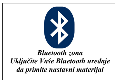
Slika 3: Obaveštenje

Aplikacija se može učenicima distribuirati preko Interneta preuzimanjem sa veb servera, mailom it. Jedan od načina za distribuciju nastavnih materijala je preko Bluetooth-a. Na laptop računaru se nalaze server i nastavni sadržaji za distribuciju. U učionici se nalazi obaveštenje kao na sl. 3 . Kada se učenici nađu u Bluetooth zoni a pri tome imaju uključen Bluetooth na svojim telefonima server automatski registruje njihove uređaje i postavlja im pitanje da li žele da prime novi nastavni materijal. Ako to prihvate preuzeće ga na telefon.